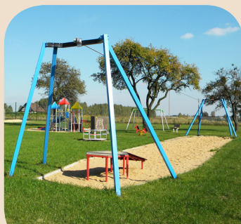
PLAC ZABAW W MIEJSCOWOŚCI TEOLIN

Stowarzyszenie - Lokalna Grupa Działania „STER” ul. Rokocińska 125 lok. 26, 95-020 Andrespol