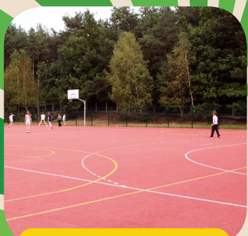
BOISKO W BEDONIU