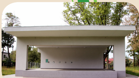
SCENA WRAZ Z ZAPLECZEM W WOLI RAKOWEJ