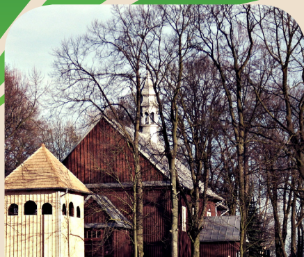
DZWONNICA PRZY KOŚCIELE PW. MATKI BOSKIEJ RÓŻAŃCOWEJ W ŁAZNOWIE